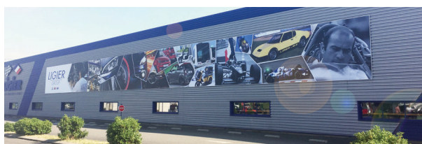
Siège social LIGIER GROUP Abrest